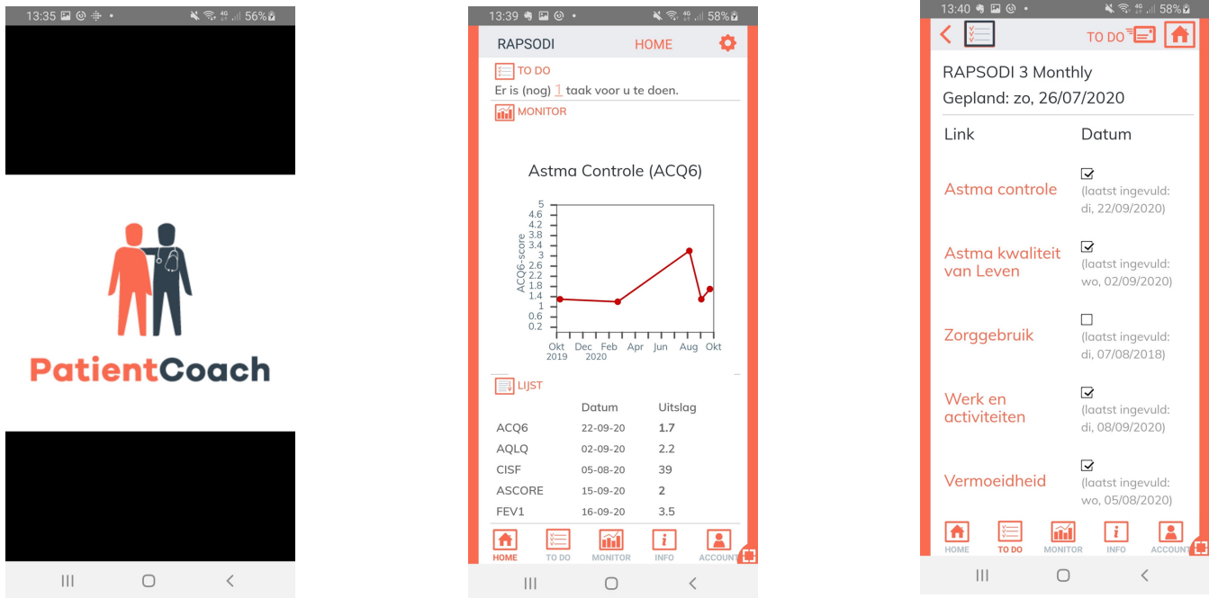
Fig. 2. Screenshots from the PatientCoach app (d.d. 02/10/2020)

We are very happy to announce that the PatientCoach app will be soon available to all RAPSODI patients. The app was developed and tested by our ICT experts and is now being evaluated by some of our RAPSODI patients for the final check.